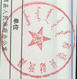
县级财政资金分配表